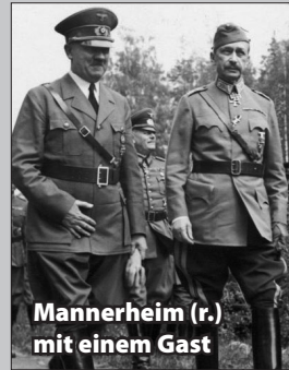
Mannerheim (r.) mit einem Gast

Im heutigen Finnland gilt er als Nationalheld und, laut einer Fernsehumfrage, als „größter Finne aller Zeiten“. Genau 30 Jahre lang diente er in der Armee des angeblichen „Traditionsfeindes“ Russland, wo er es bis zum Generalleutnant schaffte, und sprach deswegen akzentfreies Russisch. Und er kam als „größter Finne“ über rudimentäre Finnischkenntnisse nie hinaus. Bei seinem 75. Geburtstag im Jahr 1942 war Adolf Hitler persönlich zu Gast, obwohl Mannerheim später meinte, dass er ihn gar nicht eingeladen hatte... 1944 bis 1946 Staatspräsident Finnlands, starb Mannerheim 1951.